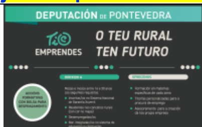
Programa TIC Emprendes