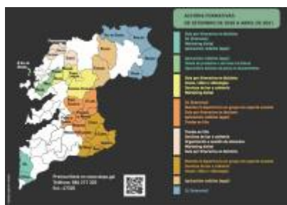
Programa TIC Emprendes